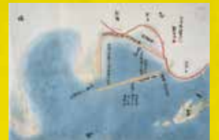
牛窓舟懸之石垣堤新敷絵図 (池田家文庫T7-58)