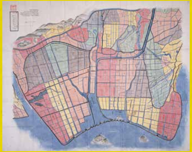
備前国上道郡沖新田図(池田家文庫T7-97)