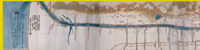
上道郡倉安川絵図(池田家文庫T7-40)