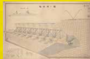
起伏堰ノ圖 第七圖(東西用水酒津樋門)