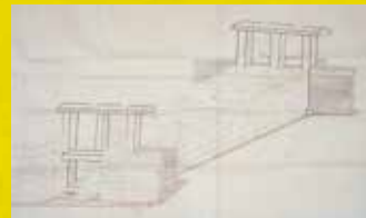
水門組立之図 (池田家文庫T7-57-5)