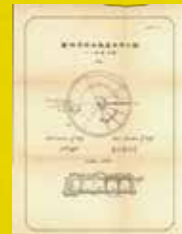
岡山市水道配水地明細圖