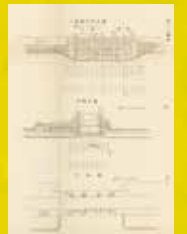
三連開門設計圖 (児島湾干拓)