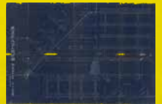
恩原貯水池ダム設計圖